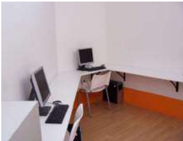
SALA DE ORDENADORES