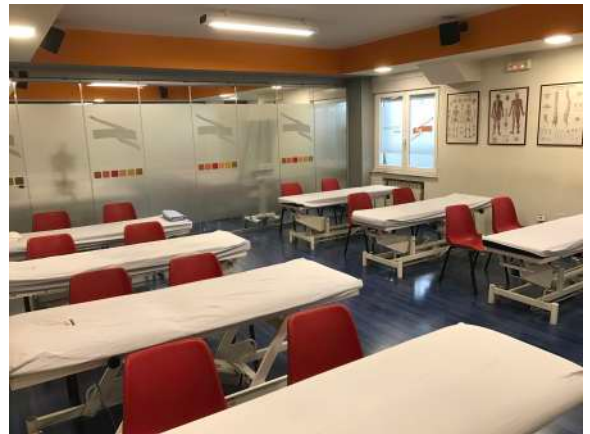
AULA DE PRÁCTICAS 1