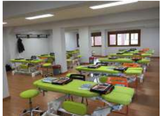
AULA DE PRÁCTICAS Nº 2