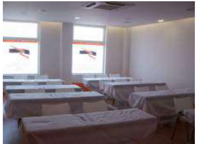
AULA DE PRÁCTICAS N° 2