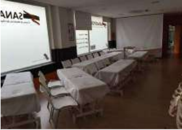
AULA DE TEORIA

SEDE DE AVDA DE AVDA DE NOCEDO 96 - LEON