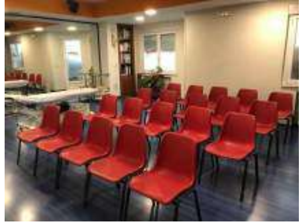
AULA DE TEORIA