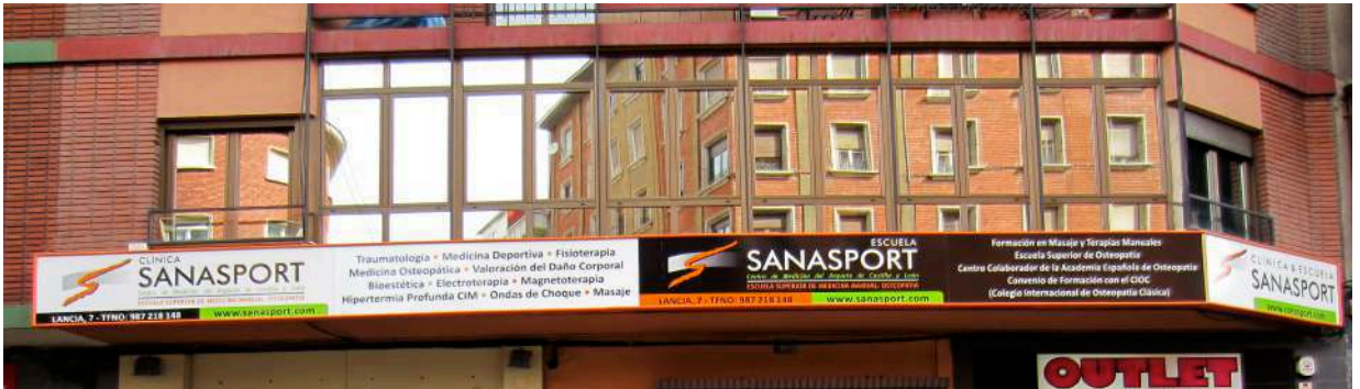
Fachada principal a Avda de Lancia

EN LA CLÍNICA SANASPORT TRABAJAN EN EQUIPO TRAUMATOLOGOS, ESPECIALISTAS EN MEDICINA DEPORTIVA, FISIOTERAPEUTAS Y OSTEOPATAS.