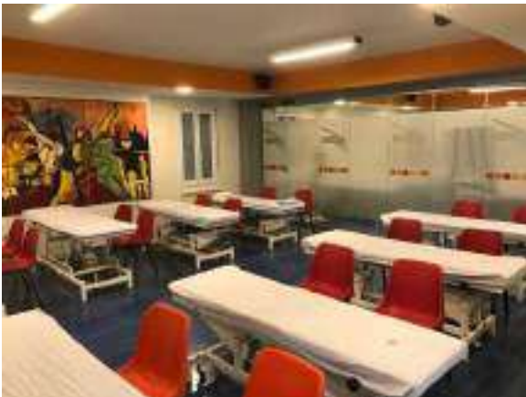
AULA DE PRÁCTICAS 1