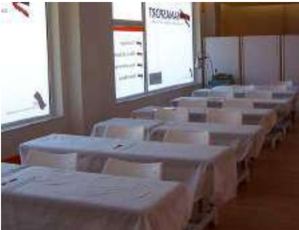
AULA DE PRÁCTICAS N° 1