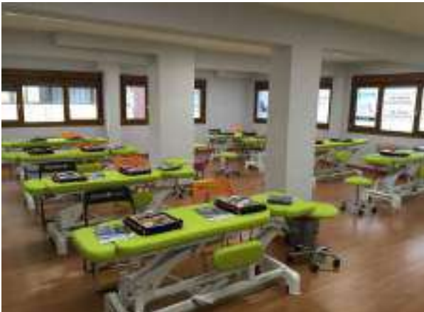
AULA DE PRÁCTICAS Nº 1