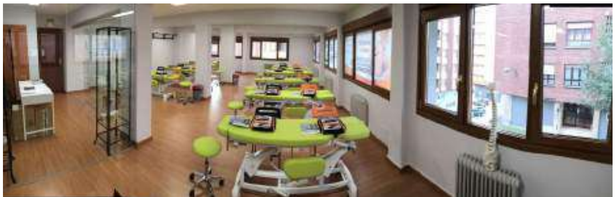
AULA DE PRÁCTICAS Nº 1 - PRINCIPAL