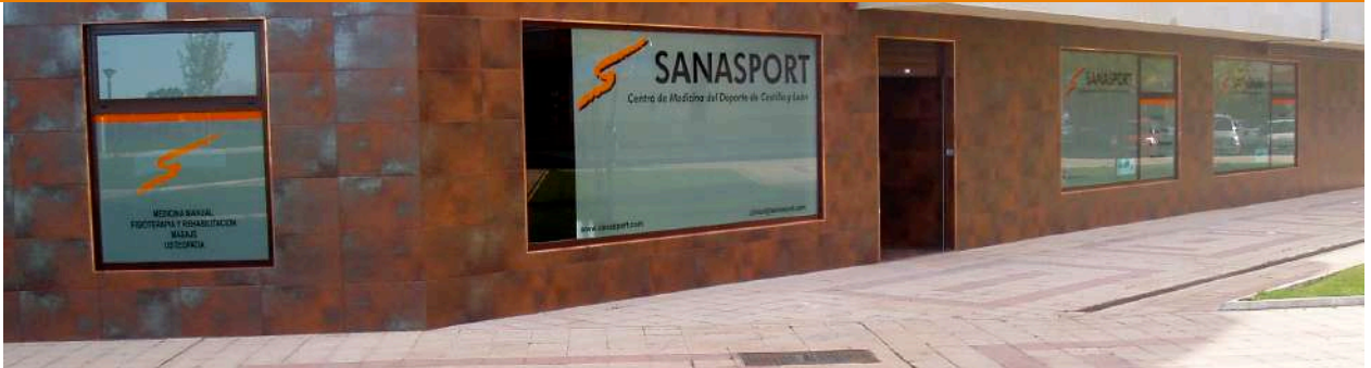
FACHADA PRINCIPAL A AVDA DE NOCEDO N° 96

SEDE DE AVDA DE AVDA DE NOCEDO 96 - LEON