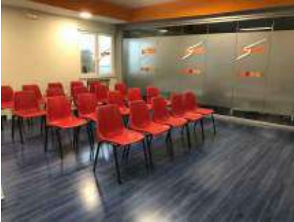
AULA DE TEORIA